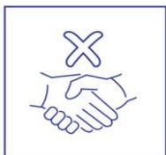
schud geen handen