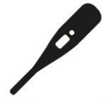
Verhoging of koorts