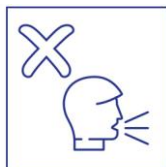
geforceerd stemgebruik niet toegestaan