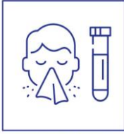
heb je klachten? blijf thuis en laat je testen