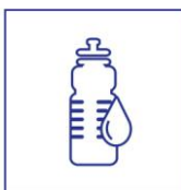
neem je eigen bidon mee