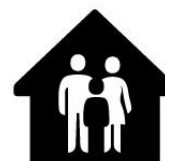
Blijf 10 dagen in quarantaine indien nodig

Namens voorzitter en bestuur van SV, veldvoetbal, handbal, korfbal & Jeu de Boules.