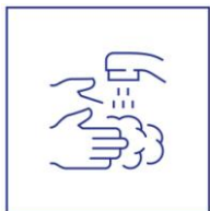
was vaak je handen