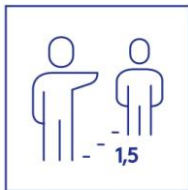
houd vanaf 18 jaar 1,5 meter afstand